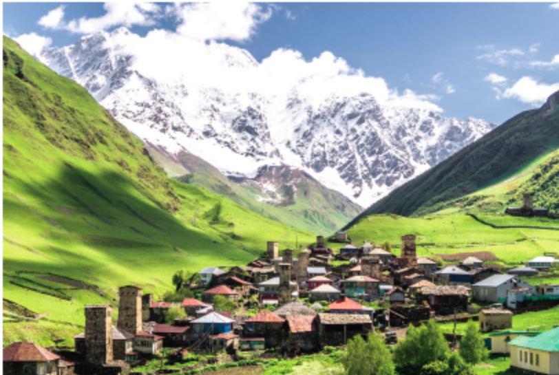
בשער: הכפר אושגולי, מחוז סוונטי עילית.