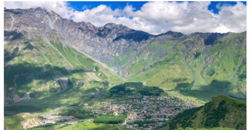
בתמונה: תצפית על הכפר קזבגי מכנסיית השילוש הקדוש.

כנסיית השילוש הקדוש (2,200 מטרים), או בשמה השני צְמִינְדָה סְסֶבָה (Tsminda Sameba), מזמן כבר הפכה לסמל בגאורגיה. הכנסייה מושכת אליה מבקרים רבים בשל המיקום הייחודי שלה, על קצה ההר מול רכסי ההרים הדרמטיים, ומשקיפה לעבר הכפר קזבגי והסביבה. אומרים שמי שלא מבקר בכנסייה מהמאה ה-14 במיקום עוצר הנשימה - לא ביקר בקזבגי באמת... על מנת להגיע לכנסייה יש לצעוד או לנסוע ברכב מהכפר קזבגי, דרך הכפר גרגטי (Gergeti), עד שמגיעים לכנסייה (5.5 קילומטרים מהכפר).