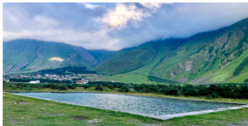
בתמונה: המעיין הטבעי בפנשתי, מחוז מצחחה-מתיאנתי.

טיול אופניים במזג אוויר הררי וצלול יכול להיות חוויה מעניינת וכיפית במיוחד! בקזבגי ניתן למצוא חנויות להשכרת אופניים לכמה שעות או ליום שלם. בחלק מהמסלולים שעליהם אפשר בהמשך ניתן לרכוב על אופניים. השכרת אופניים עולה 15-20 לארי ליום.