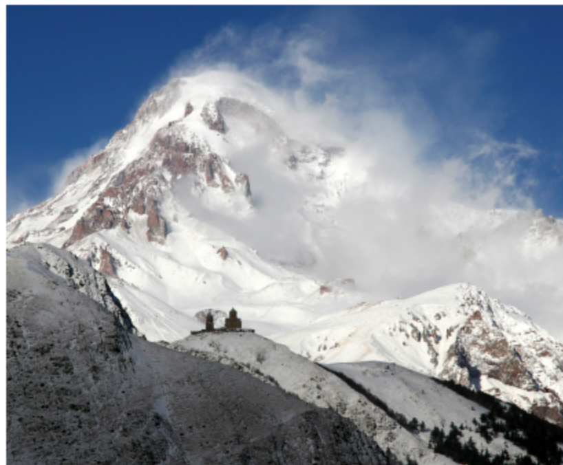
בתמונה: פסגת הר קזבק וכנסיית השילוש הקדוש.

מרגע שמגיעים לכפר ג'וטה (2,200 מטרים), ניתן לצעוד לכיוון רוֹשְׁקָה, דרך עמק צ'אוּחִי (Chaukhi) שלמרגלות הר צ'אוּחִי, ועד למעבר ההרים צ'אוּחִי (Chaukhi Pass) בגובה 3,338 מטרים. סך הכל עד למעבר ההרים הליכה של 9 קילומטרים (כארבע שעות). ממעבר ההרים יורדים לכיוון הכפר רוֹשְׁקָה. בדרך עוברים באגמי אבדלאורי (Abudelaury Lakes) - שלושה אגמים בצבעי כחול, ירוק ולבן המקבלים את הצבעים שלהם מהטבע הסובב אותם (ניתן לראות אותם ממעבר ההרים צ'אוּחִי. ממעבר צ'אוּחִי, האגם הראשון שנראה נמצא בגובה 2,830 מטרים וצבעו לבן בשל השלגים שמסביבו. האגם השני, הירוק, נמצא בגובה 2,610 מטרים והאגם השלישי, הכחול, בגובה 2,580 מטרים. מהאגמים ועד לכפר רוֹשְׁקָה ההליכה נמשכת בין שעתיים לשלוש שעות. הדרך מג'וטה ועד רוֹשְׁקָה נמשכת כיומיים ואורכה כ-20 קילומטרים. עבור חובבי הטיולים והטבע - הטרק הזה מומלץ מאוד ומשלב נופים שלא רואים בטרקים אחרים בגאורגיה. מהכפר רוֹשְׁקָה אפשר להמשיך עד לכפר שאטילי (פירוט בעמוד הבא), באמצעות טרמפ, או רגלית ובכך להאריך את הטרק בעוד יומיים. לחלופין, ניתן לחזור חזרה לטביליסי.